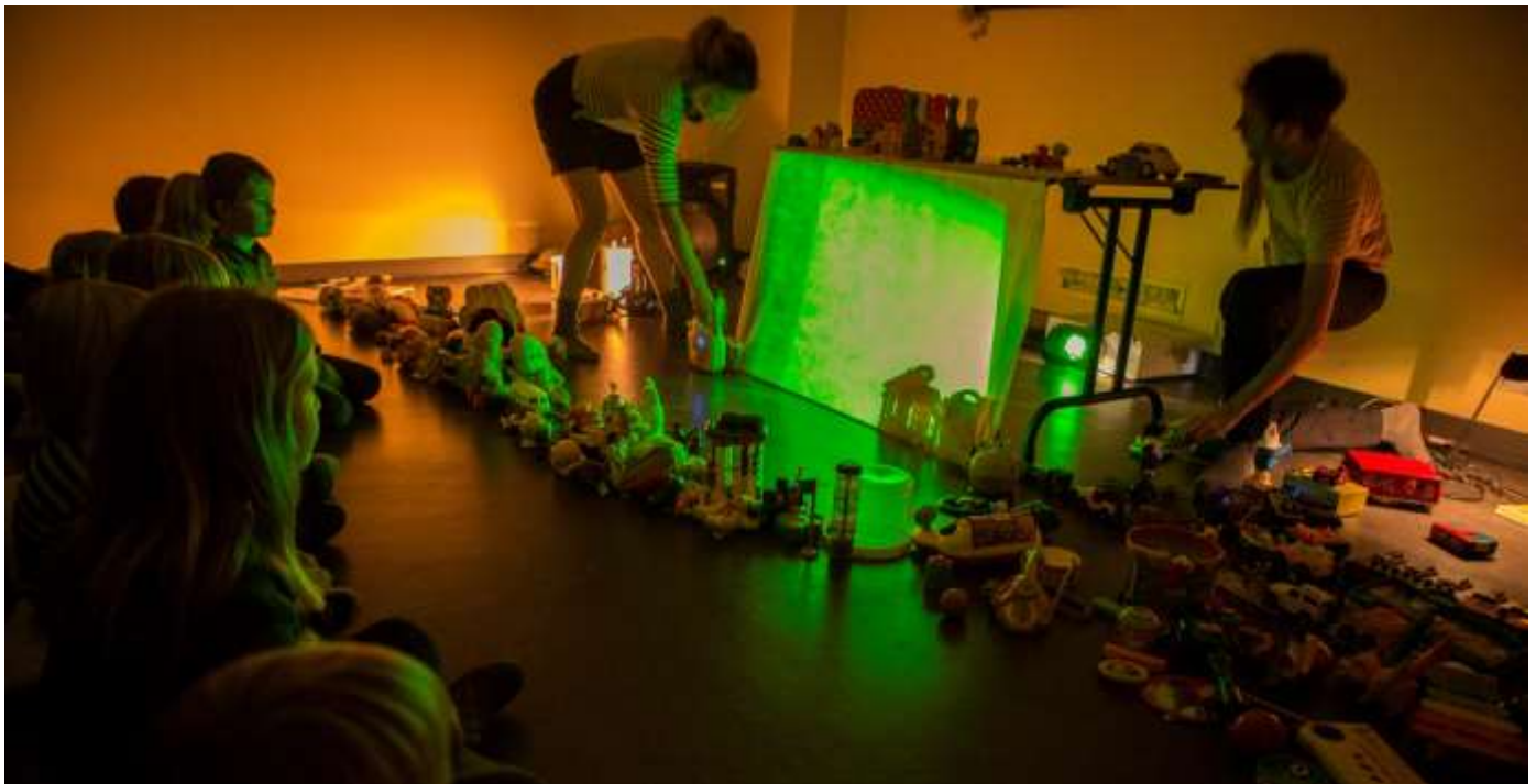
MADE IN EL KWAKKABA 9 november blz. 6