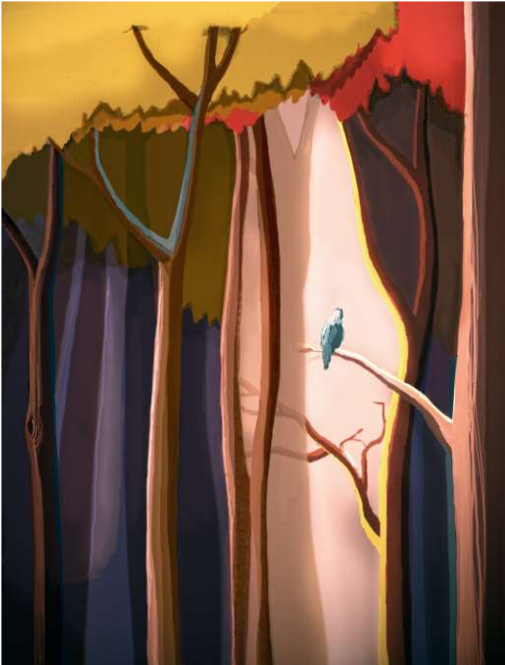
BOOM door TAL&THEE 28 november blz. 9